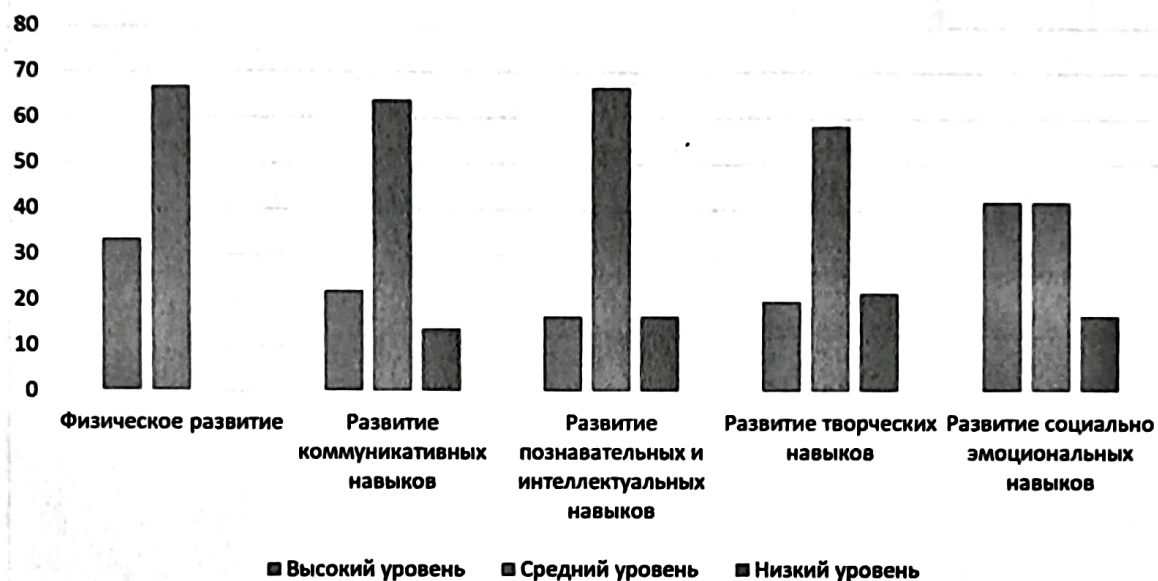
Диаграмма диагностики на сентябрь 2023г